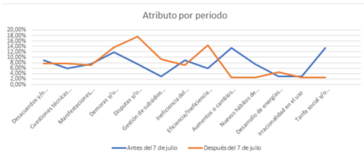
Gráfico N° 2. Fluctuación de los atributos por período

entre éstas y los entes reguladores (8,2%). Nuevamente, estos hallazgos dan cuenta del énfasis otorgado en la cobertura a los aspectos de los temas que se vinculan con conflictos y enfrentamientos en el marco de las subas.