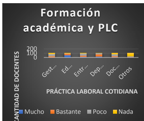
Ilustración 3 Formación Docente y Práctica Laboral Cotidiana. Erdociacín y Adorante

La formación docente en Educación física tiene los antecedentes teóricos de formar para los campos profesionales ya mencionados, pero que a partir de ello es que hemos identificado las áreas laborales y las que hemos definido como Práctica laboral cotidiana, que serán en adelante las variables que predominarán en nuestro estudio. A continuación, encontramos desde la percepción de los docentes (ver ilustración 4) a partir de sus propias experiencias, que las PLC para las que forma la carrera docente en Educación física son: en primer lugar, la Educación Física Escolar (85%), luego el Deporte Masivo (76%) y, en tercer término, el Rendimiento Deportivo (38%). La opción “Otros” fue elegida en cuarto lugar, aunque entran en ella variadas características que no se consideran por no ser significativas, aunque tampoco se descarta a fin de realizar a futuro una mirada reflexiva sobre el tema, ya que aparecen nuevos indicadores en referencia a salud, tercera edad, y discapacidad, como principales elecciones.